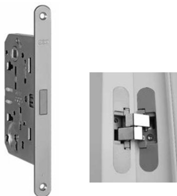
SERRATURA MAGNETICA E CERNIERA A SCOMPARSA