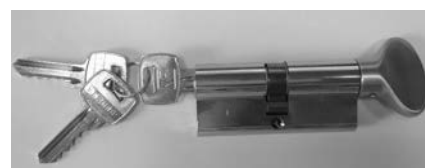
CILINDRO YALE (CHIAVE/POMOLO) A RICHIESTA