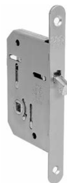
SERRATURA SCIVOLA T SCORREVOLI