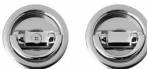
APPIGLIO TONDA PER PORTA PIEGO