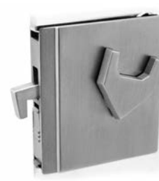
SERRATURA L/O SCORREVOLI ALASKA