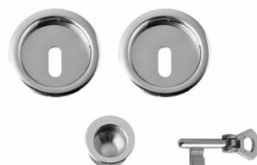
CHIAVE SU L/O TONDA E DITALE