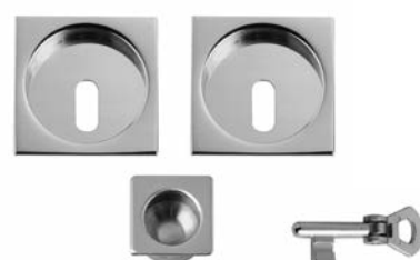
CHIAVE SU L/O KUADER E DITALE