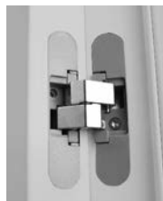
SERRATURA MAGNETICA E CERNIERA A SCOMPARSA