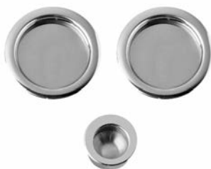
UNGHIATA TONDA E DITALE