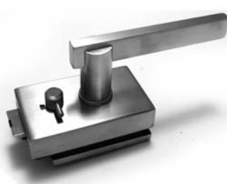
SERRATURA PREDISPOSTA PER MANIGLIA BP CON L/O ALASKA