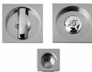
L/O KUADER E DITALE