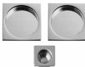
UNGHIATA KUADER E DITALE