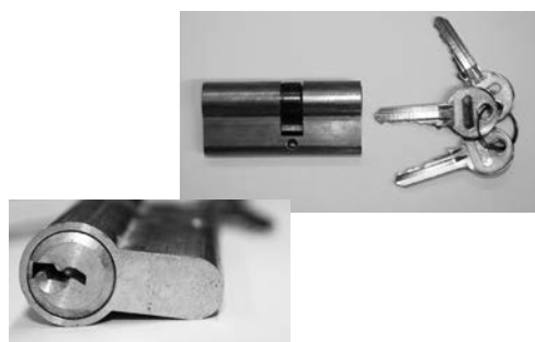
CILINDRO YALE (CHIAVE/CHIAVE) DI SERIE