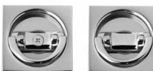
APPIGLIO KUADER PER PORTA PIEGO