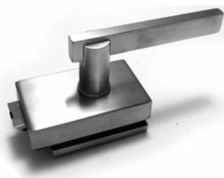
SERRATURA PREDISPOSTA PER MANIGLIA BP ALASKA