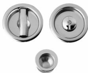
L/O TONDA E DITALE