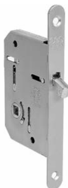
SERRATURA SCIVOLA T SCORREVOLI