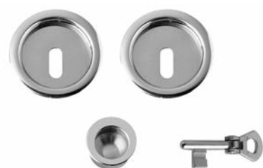
CHIAVE SU L/O TONDA E DITALE