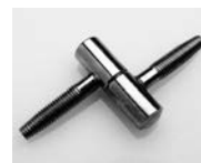
SERRATURA MEDIANA E ANUBA CON CAPPUCCI